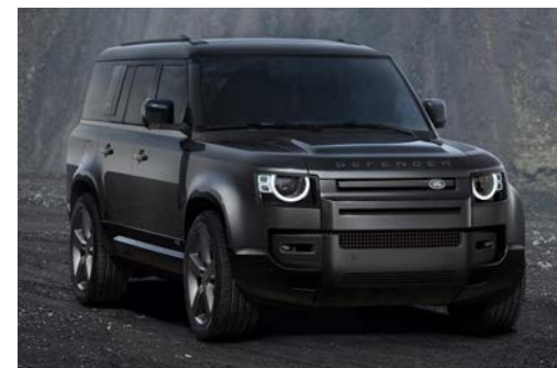
DEFENDER 130 V8