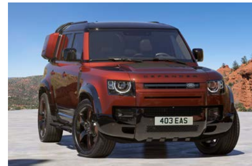
DEFENDER 110 SEDONA EDITION

Vyobrazené vozidlo je pouze ilustrační a může mít doplňkovou výbavu. Další informace o doplňkové výbavě a její dostupnosti obdržíte od svého partnera Land Rover.