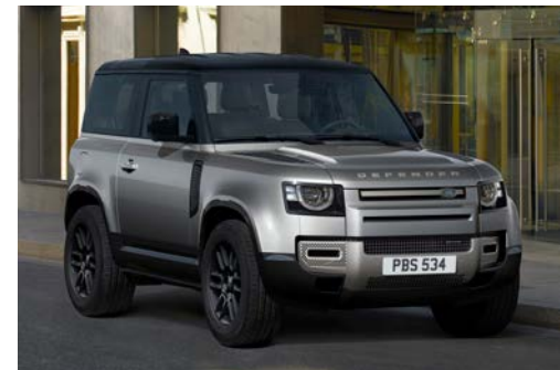
DEFENDER 90 X-DYNAMIC SE