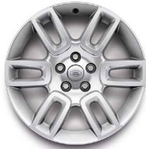
19" (STYLE 6010) 2,3 GLOSS SPARKLE SILVER Standardní výbava pro verze S a Hard Top S