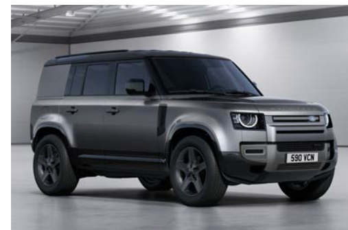
DEFENDER 110 HARD TOP X-DYNAMIC SE