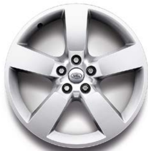
20" (STYLE 5098) 2,4,5 POLISHED SILVER