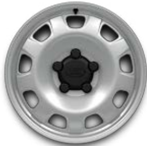
20" (STYLE 9013) 2,10 GLOSS WHITE