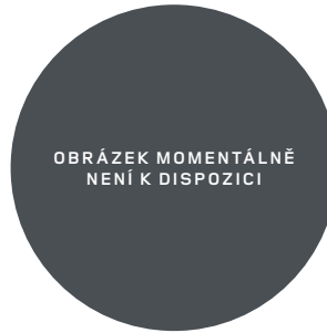
22" (STYLE 7026) 2,7,11 DIAMOND TURNED WITH GLOSS BLACK CONTRAST