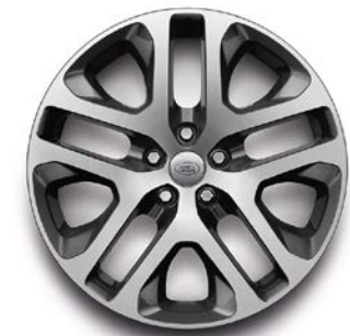
20" (STYLE 5095) 2,4 DIAMOND TURNED, GLOSS DARK GREY CONTRAST