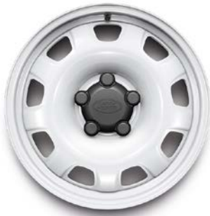
18" PLECHOVÁ (STYLE 5093) 1 GLOSS WHITE