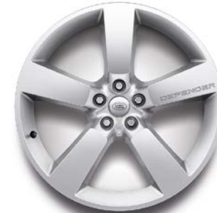
22" (STYLE 5098) 2,7,13,14 GLOSS SPARKLE SILVER Standardní výbava verze X