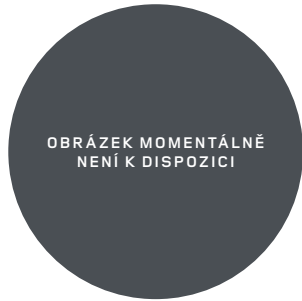
22" (STYLE 7026) 2,7,11 GLOSS BLACK Standardní výbava verze OCTA