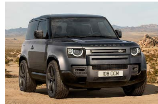
DEFENDER 90 V8