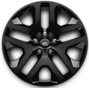
20" (STYLE 5095) 2,9 GLOSS BLACK Standardní výbava verze Outbound