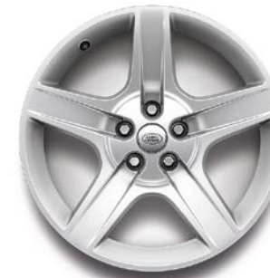
20" (STYLE 5094) 2,4 GLOSS SPARKLE SILVER