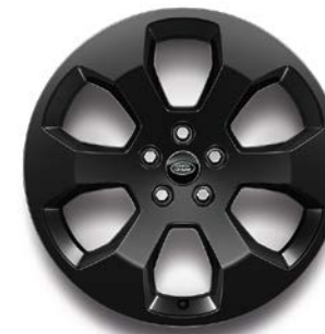
20" (STYLE 6011) 2,7,8 GLOSS BLACK