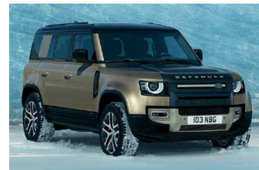
DEFENDER 110 X