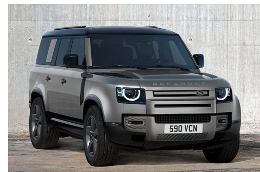
DEFENDER 130 X-DYNAMIC HSE