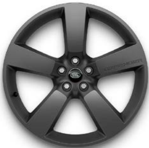
22" (STYLE 5098) 2,7,13,14,16 SATIN DARK GREY Standardní výbava verze V8