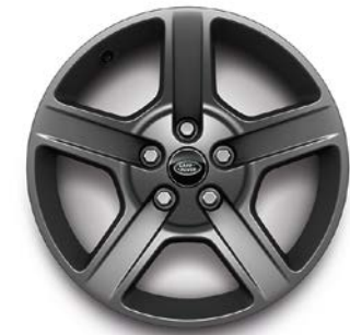
20" (STYLE 5094) 2,4 SATIN DARK GREY Standardní výbava pro verze X-Dynamic SE a Hard Top X-Dynamic SE