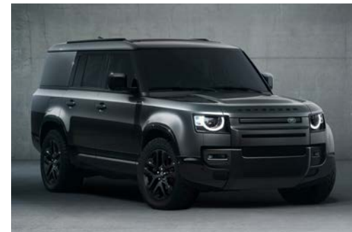
DEFENDER 130 OUTBOUND

Upozorňujeme, že standardní výbava může být nahrazena doplňkovou výbavou.