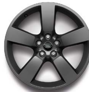
20" (STYLE 5098) 2,5,6 SATIN DARK GREY Standardní výbava verze X-Dynamic HSE