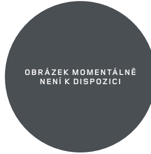
20" (STYLE 1086) 2,11,12 DIAMOND TURNED SATIN DARK TINT S KONTRASTNÍM LAKEM V ODSTĪNU SATIN BLACK Standardní výbava verze OCTA Edition One