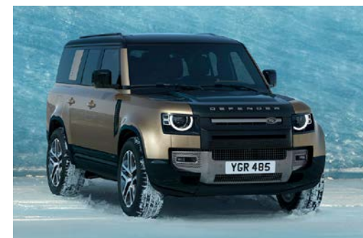
DEFENDER 130 X