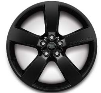
22" (STYLE 5098) 2,7,13,14,15 GLOSS BLACK Standardní výbava verze Sedona Edition