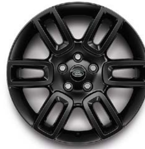
19" (STYLE 6010) 2,3 GLOSS BLACK