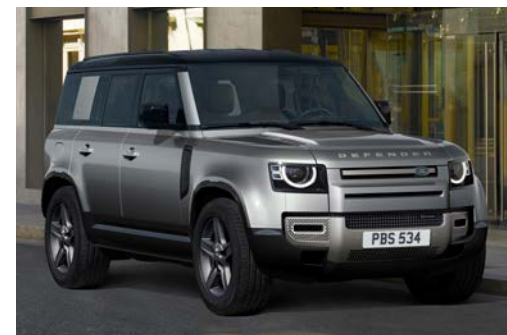
DEFENDER 110 X-DYNAMIC SE