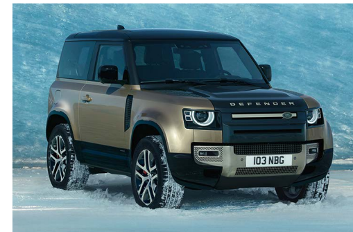
DEFENDER 90 X