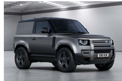
DEFENDER 90 HARD TOP X-DYNAMIC SE