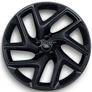
22" S 5 DVOJITÝMI PAPRSKY (STYLE 5131) 1 SATIN BLACK, GLOSS BLACK CONTRAST