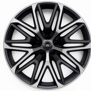
22" S 10 DVOJITÝMI PAPRSKY (STYLE 1083) 2 SATIN DARK GREY CONTRAST, DIAMOND TURNED