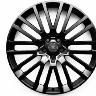
23" S 10 DVOJITÝMI PAPRSKY (STYLE 1084) 2 DUO TONE SATIN/GLOSS BLACK, KOVANÁ