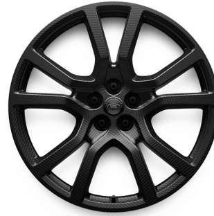
23" S 5 DVOJITÝMI PAPRSKY (STYLE 5132) 2 UHLÍKOVÁ VLÁKNA V ODSTÍNU SATIN GREY TINT