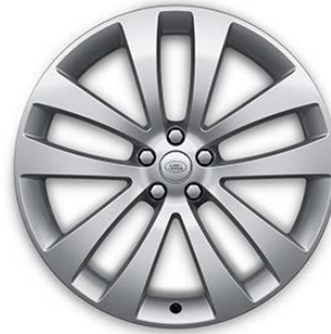
23" S 5 DVOJITÝMI PAPRSKY (STYLE 5135) 3 SPARKLE SILVER