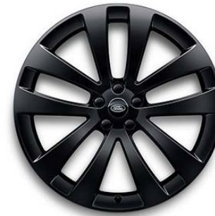
23" S 5 DVOJITÝMI PAPRSKY (STYLE 5135) 2 GLOSS BLACK