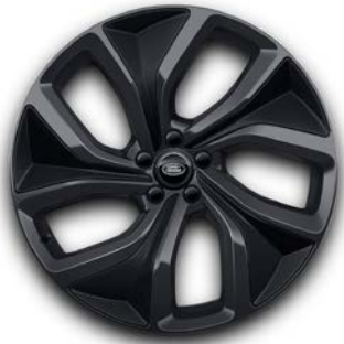
23" S 5 DVOJITÝMI PAPRSKY (STYLE 5128) 1 DARK GREY, CARBON INSERTS