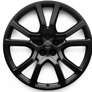
23" S 5 DVOJITÝMI PAPRSKY (STYLE 5132) 2 UHLÍKOVÁ VLÁKNA V ODSTÍNU GLOSS DARK TINT