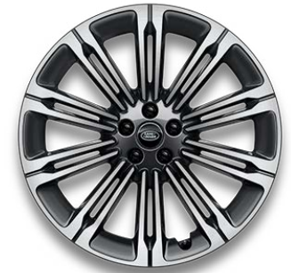
23" S 10 DVOJITÝMI PAPRSKY (STYLE 1075) 1 GLOSS DARK GREY CONTRAST, DIAMOND TURNED