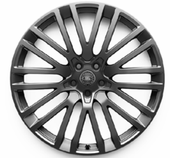
23" S 10 DVOJITÝMI PAPRSKY (STYLE 1084) 2 POLISHED DARK GREY, KOVANÁ